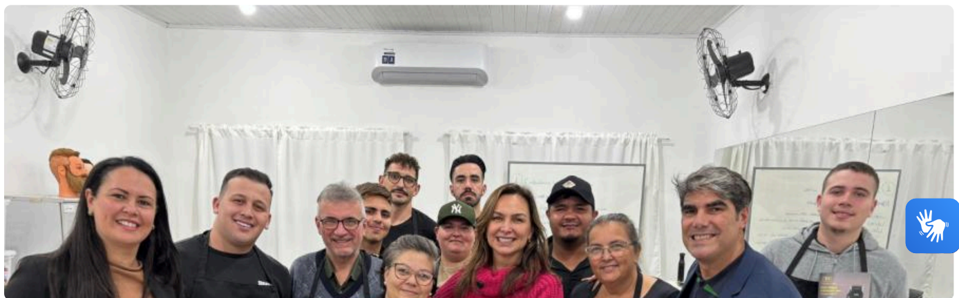
Projeto MEI nos Bairros em fase de andamento recebe visita da vice-prefeita