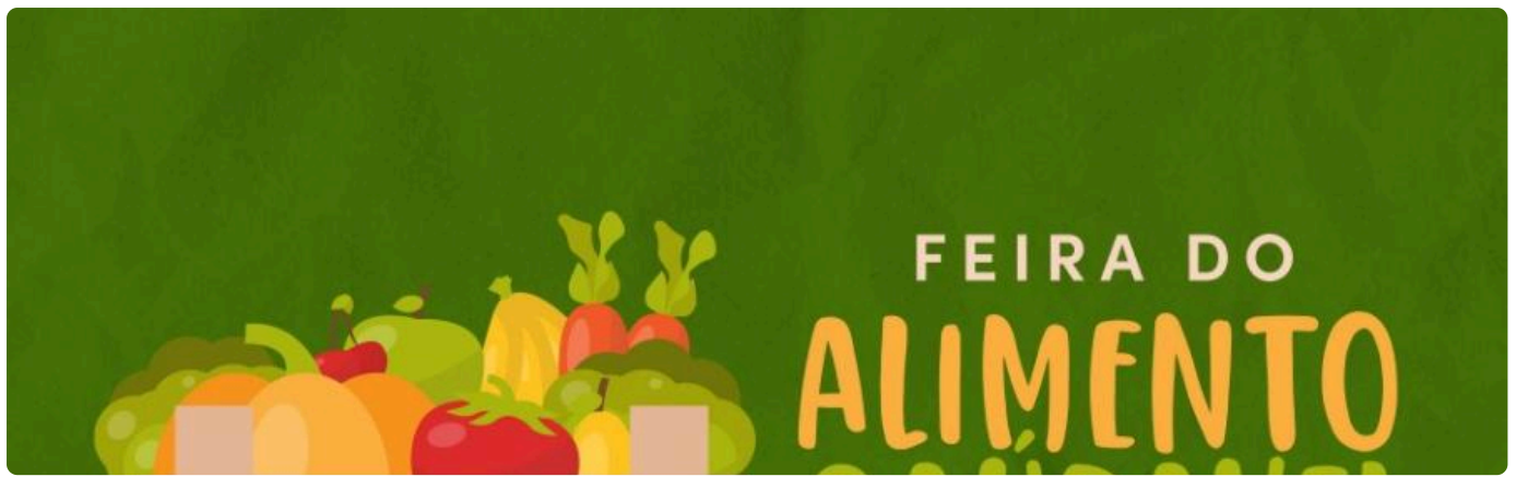
Feira do Alimento Saudável será realizada no fundo da praça do Imigrante neste sábado