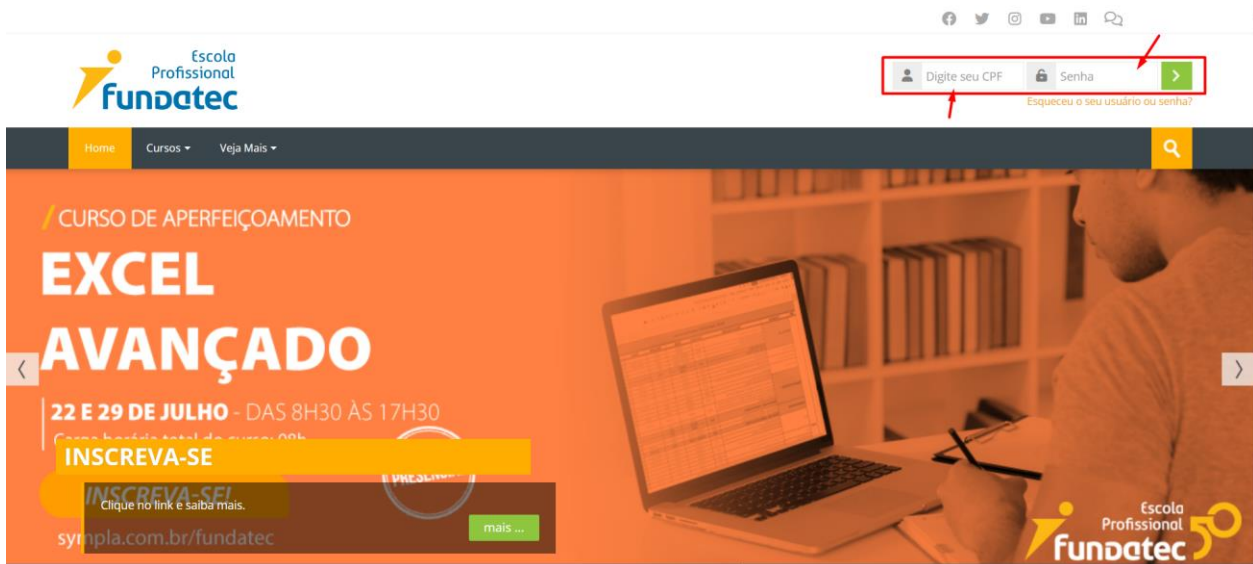
Figura 1 – Ao acessar o site http://ead.fundatec.org.br o candidato deve inserir seus dados de acesso nos campos “Digite seu CPF” e “Senha”.

Candidato com CPF 123.456.789-10, o usuário será 12345678910