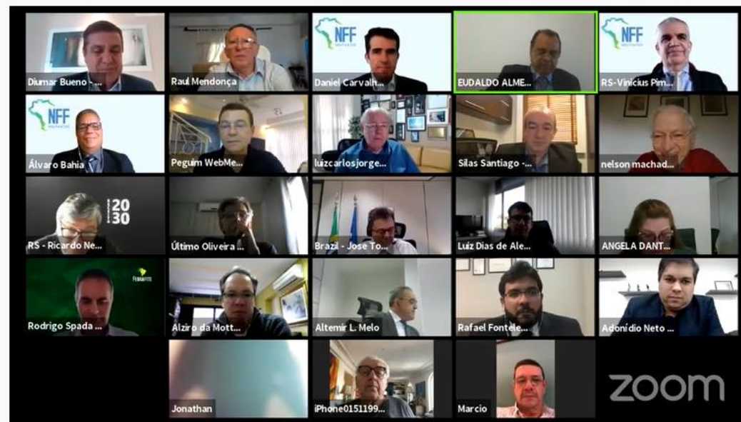
Lançamento da Nota Fiscal Fácil - NFF