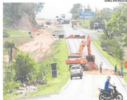
OBRA: bloqueio é entre quilômetros 52 e 54,5 da rodovia