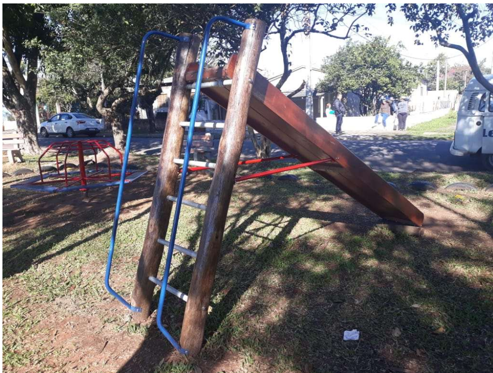
São Leopoldo, Berço da Colonização Alemã no Brasil