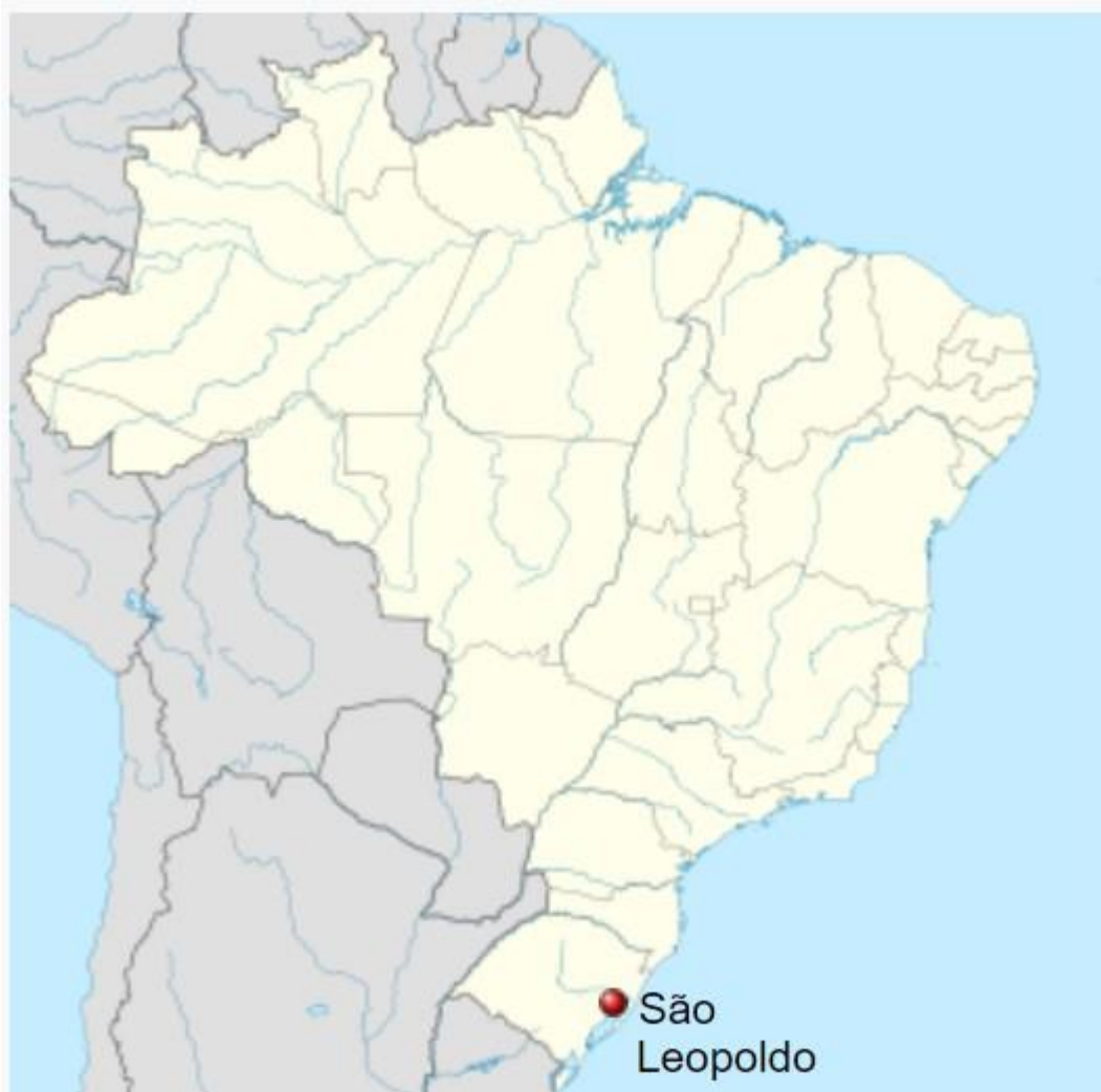
Figura 1: Localização de São Leopoldo no Brasil.

São Leopoldo está situada estrategicamente no corredor entre a Capital e a Serra Gaúcha, distante 34 Km de Porto Alegre, tendo ligação direta por via rodoviária e metroviária com o aeroporto, a rodoviária, o porto e o centro da capital. Atualmente conta com aproximadamente 230.000 habitantes, tem o 9º PIB do estado do Rio Grande do Sul.