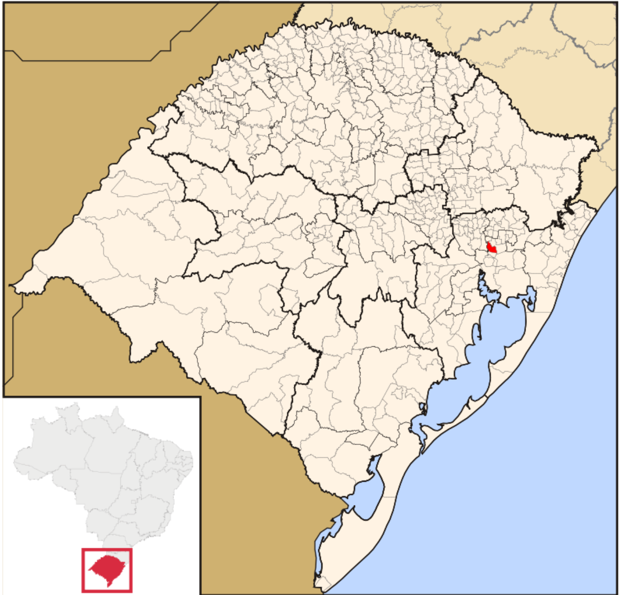
Figura 2: Localização de São Leopoldo no Rio Grande do Sul.