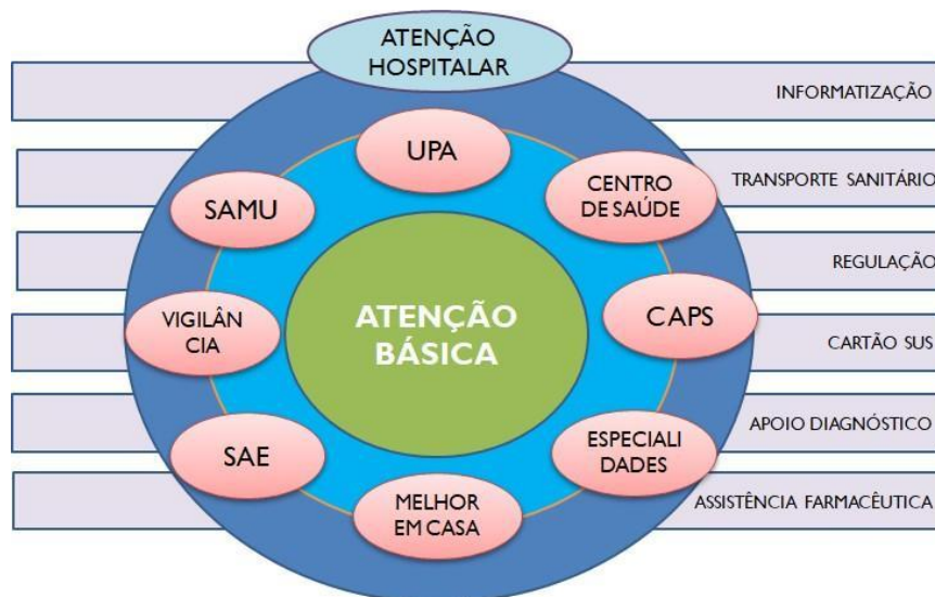
Figura 1: Rede de atenção à saúde.