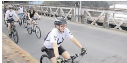
INICIATIVA: ponto de partida e de chegada no Museu do Rio, na Rua da Praia em São Leopoldo

O Eu Vou de Bike reuniu neste sábado ciclistas para seguirem os caminhos do Rio dos Sinos, percorrendo um trajeto de 12 quilômetros, tendo como ponto de partida e chegada o Museu do Rio dos Sinos. O circuito passou ainda em uma das casas de bombas, diques e Base Ecológica do Rio Velho. O passeio que envolve esporte, lazer e educação ambiental tem como objetivo alertar sobre o descarte irregular de resíduos sólidos e promover a utilização da bicicleta. "A ação oportuniza para população conhecer caminhos em São Leopoldo que estão às margens dos diques, dos arroios e principalmente do Rio dos